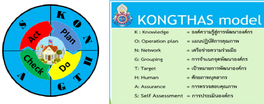
ภาพที่ 3.3 ร่างรูปแบบการพัฒนาโรงเรียนขนาดเล็กสู่ความเป็นเลิศด้วย KONGTHAS model

รูปแบบการพัฒนาโรงเรียนขนาดเล็กสู่ความเป็นเลิศ ของโรงเรียนธรรมยานประยุต สังกัดสำนักงานเขตพื้นที่การศึกษาประถมศึกษาสระแก้ว เขต 1 โดย KONGTHAS model” มี 8 องค์ประกอบที่เป็นแนวทางในการพัฒนาโรงเรียนขนาดเล็กสู่ความเป็นเลิศ ซึ่งประกอบด้วย